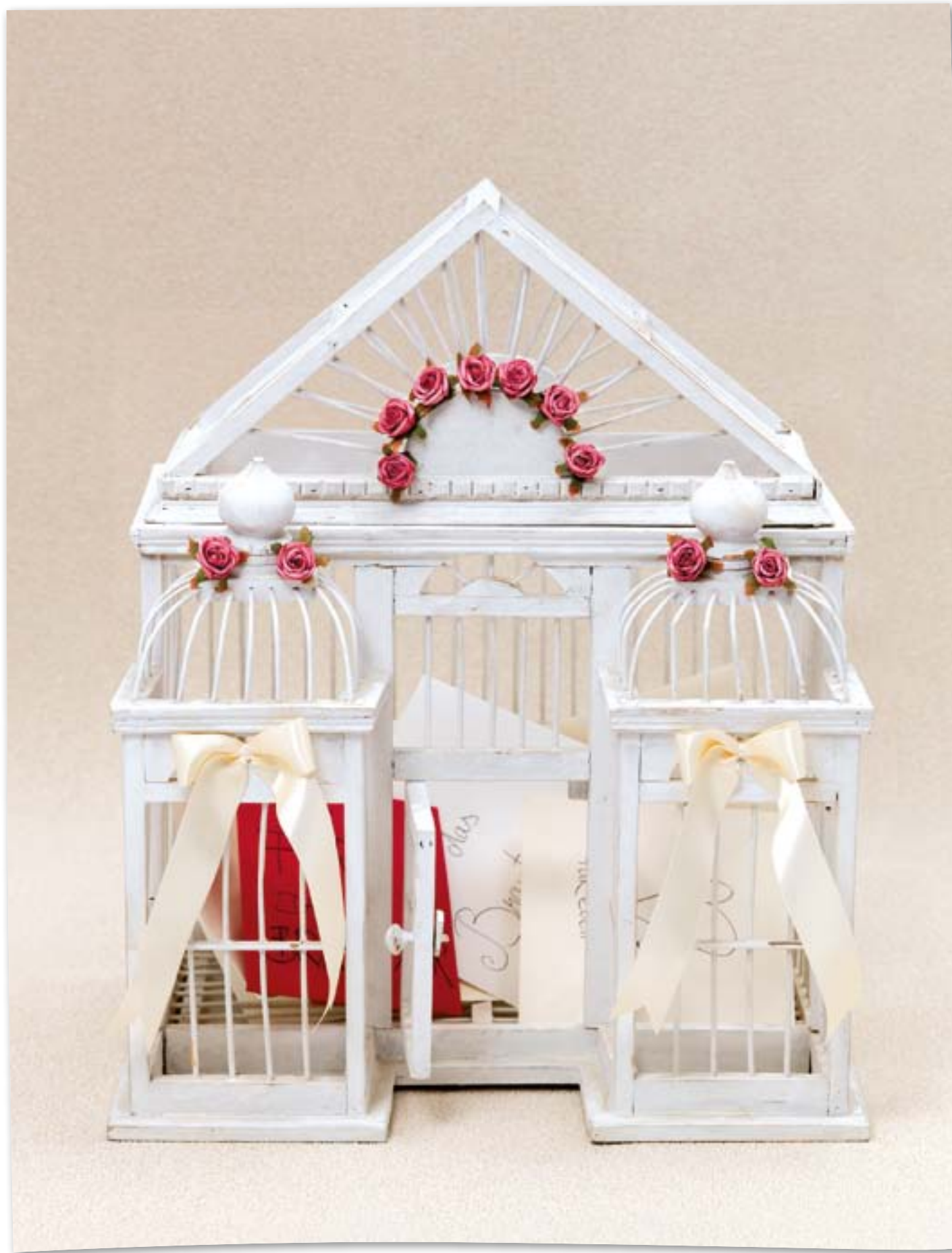
VOGELKÄFIG: Sieht er nicht aus wie eine herrschaftliche Villa? Wir haben ihn mit ein paar kleinen Röschen ( www.in-due.de ) und zwei Schleifen verziert, um dem romantischen Thema gerecht zu werden. Hier können Gäste ihre Glückwunschkarten und Geldgeschenke hineinstecken. www.ja-hochzeitsshop.de